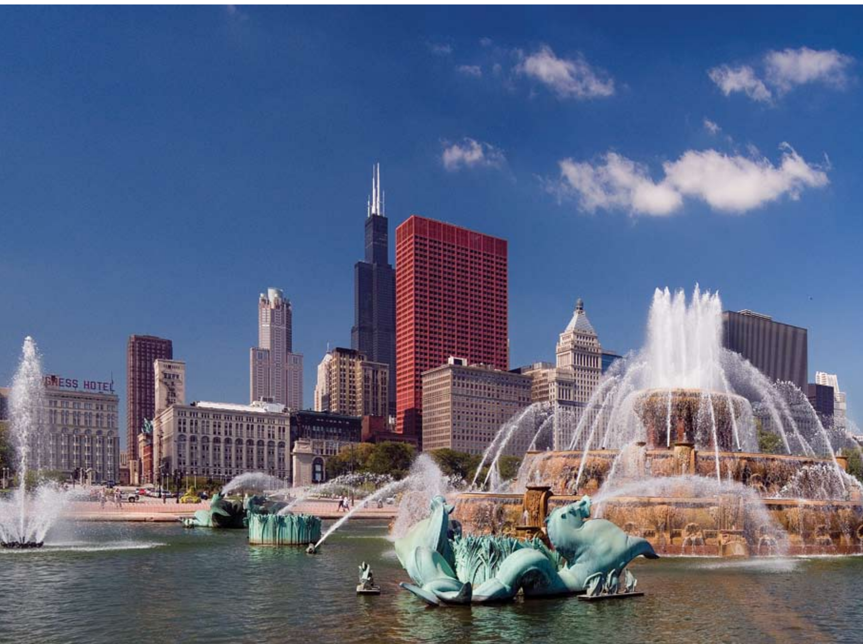
Букингемский Фонтан в Чикаго (The Buckingham Memorial Fountain, Chicago). Один из замечательных чикагских фонтанов. Панорама из шести вертикальных кадров, склейка в PTGui.